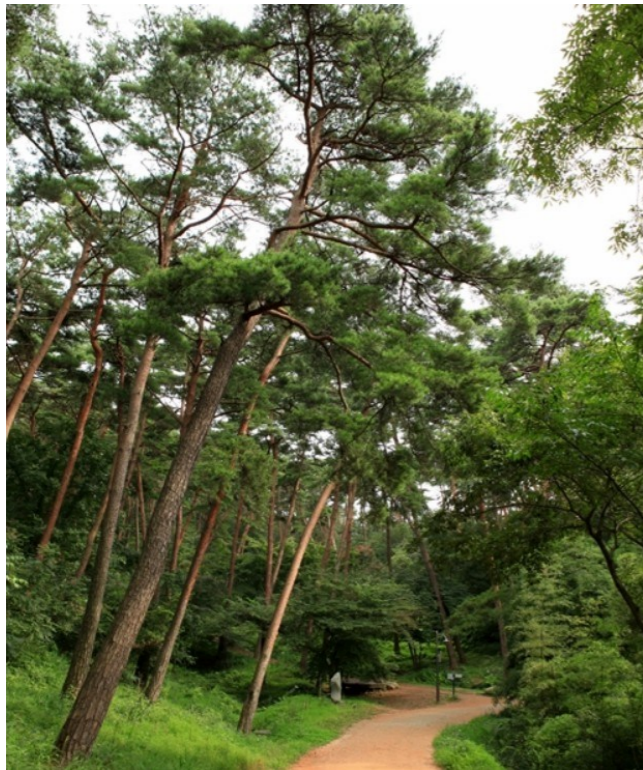
나와 직원들이 편안하게 쉴 수 있는 쉼터 안면송으로 둘러 쌓인 안락한 휴식처