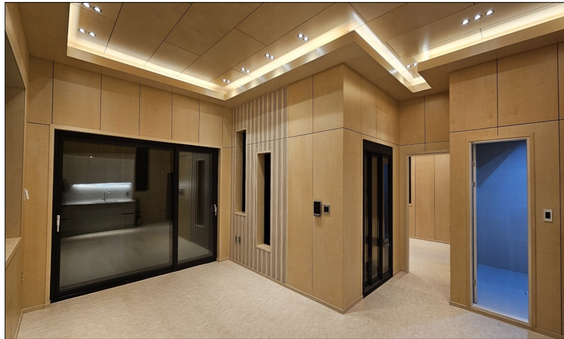
현장 실물 내부 사진입니다