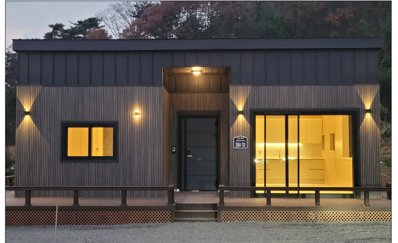
현장 실물 사진입니다